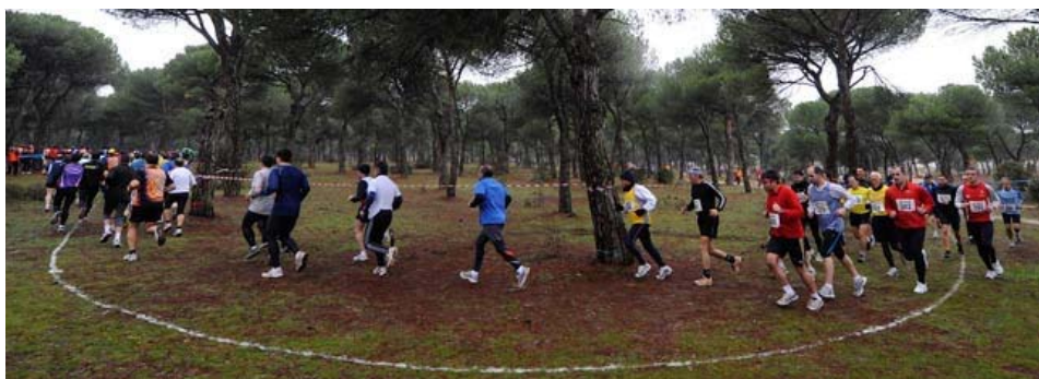
Atletas masculinos toman una curva en el Pinar de Antequera.