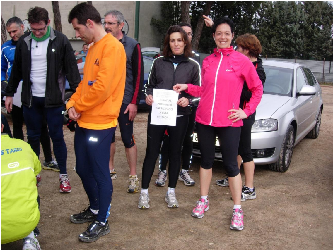
Foto de 2 de las personas que han corrido y creo que no han salido en ninguna foto (se confunden del punto de salida, no suben el turmalet,... )pero que me imagino se la dieron parda como los demás.